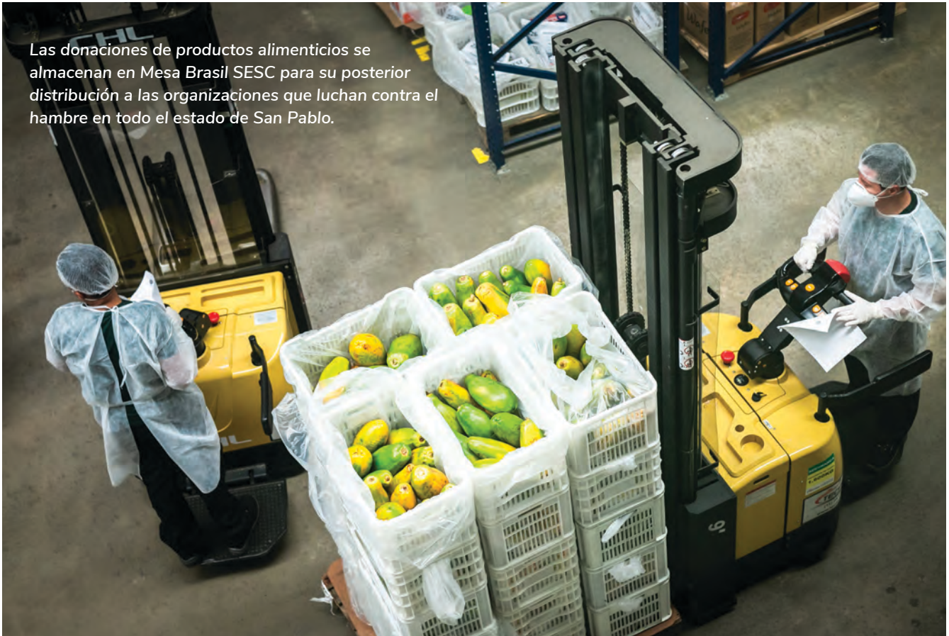
Las donaciones de productos alimenticios se almacenan en Mesa Brasil SESC para su posterior distribución a las organizaciones que luchan contra el hambre en todo el estado de San Pablo.

y distribuyen en el mismo día; y el Modelo virtual , en el que el banco de alimentos actúa como intermediario entre los donantes de alimentos y las organizaciones de servicios comunitarios. Cada modelo implica distintos requisitos y consideraciones logísticas y normativas.