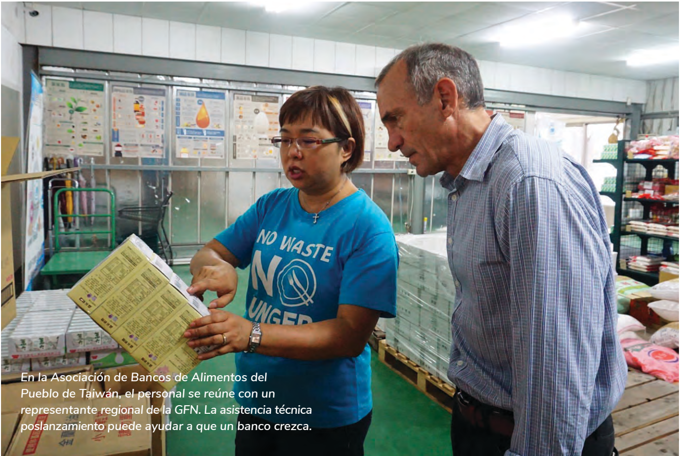
En la Asociación de Bancos de Alimentos del Pueblo de Taiwán, el personal se reúne con un representante regional de la GFN. La asistencia técnica poslanzamiento puede ayudar a que un banco crezca.