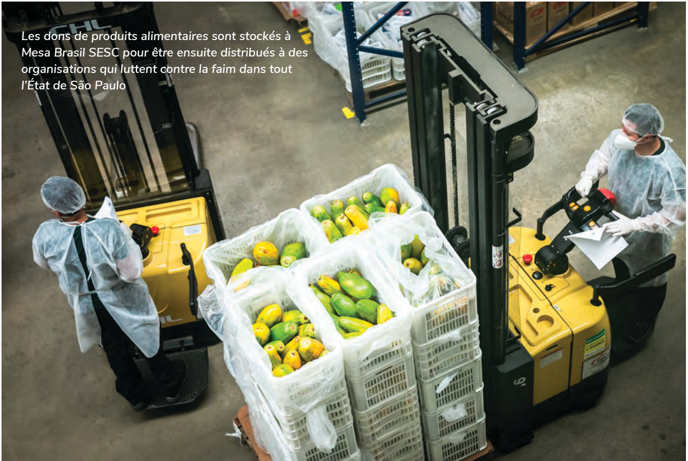
Les dons de produits alimentaires sont stockés à Mesa Brasil SESC pour être ensuite distribués à des organisations qui luttent contre la faim dans tout l'État de São Paulo

dans une installation centrale, du modèle de récupération d'aliments préparés dans lequel des denrées périssables sont collectées et distribuées le même jour, et du modèle virtuel dans lequel la banque alimentaire sert d'intermédiaire entre les donateurs de produits alimentaires et les organismes de services communautaires. Chaque modèle impose des exigences distinctes et des considérations logistiques et réglementaires.