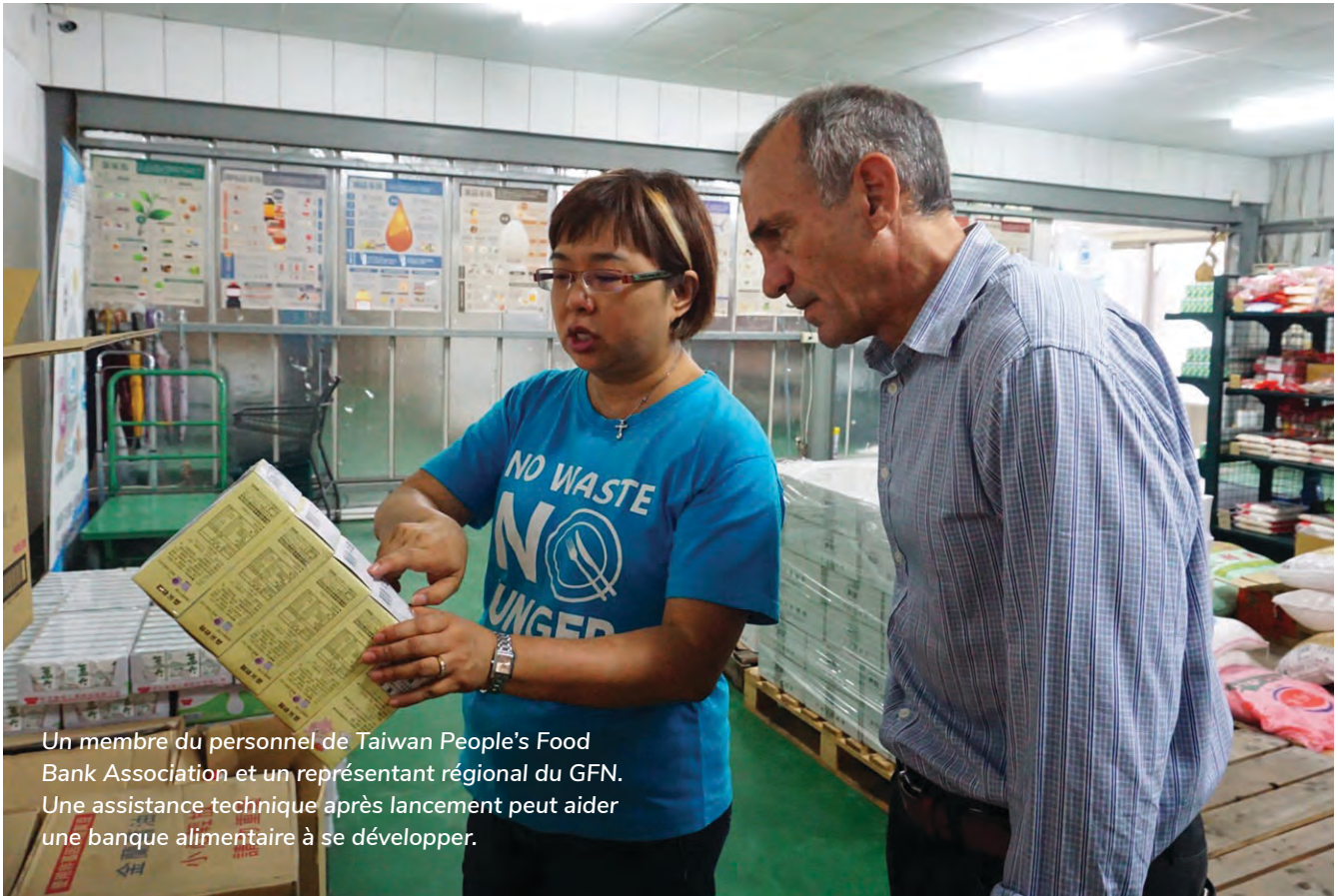
Un membre du personnel de Taiwan People's Food Bank Association et un représentant régional du GFN. Une assistance technique après lancement peut aider une banque alimentaire à se développer.