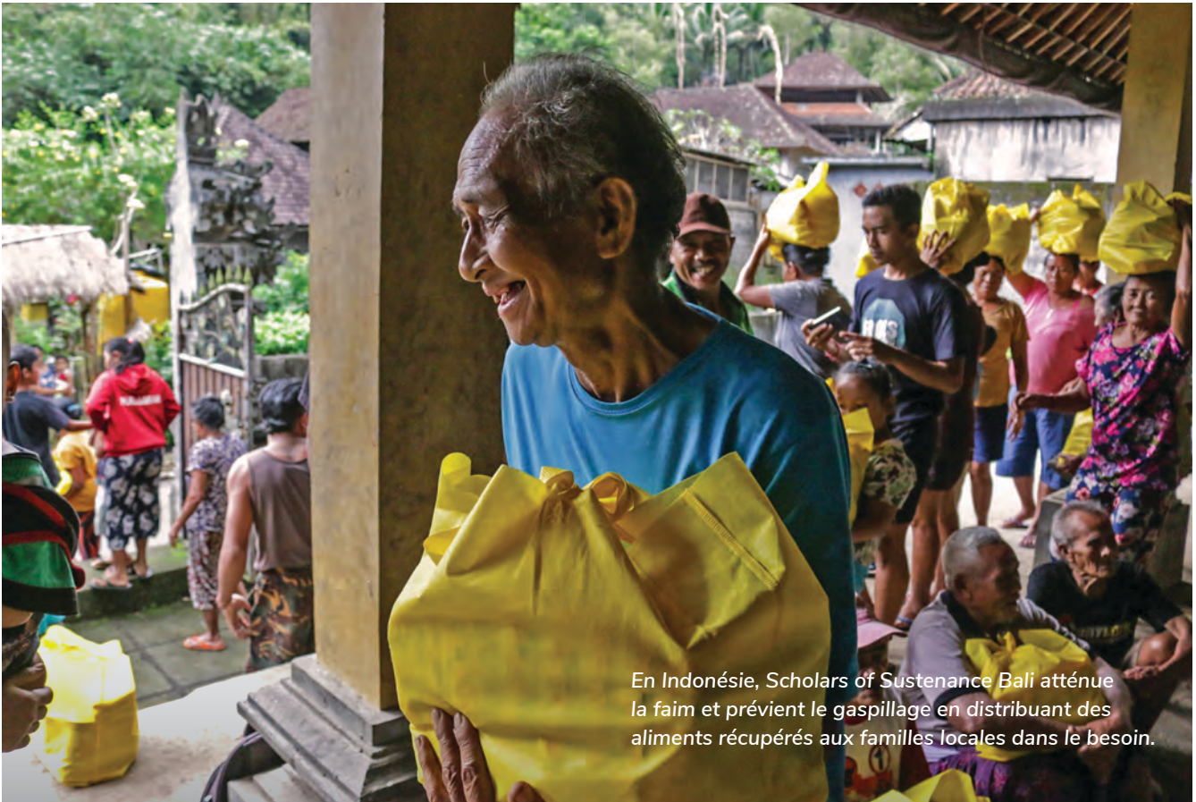
En Indonésie, Scholars of Sustenance Bali atténue la faim et prévient le gaspillage en distribuant des aliments récupérés aux familles locales dans le besoin.

l'expédition, du stockage, de la manutention et de la distribution des aliments.